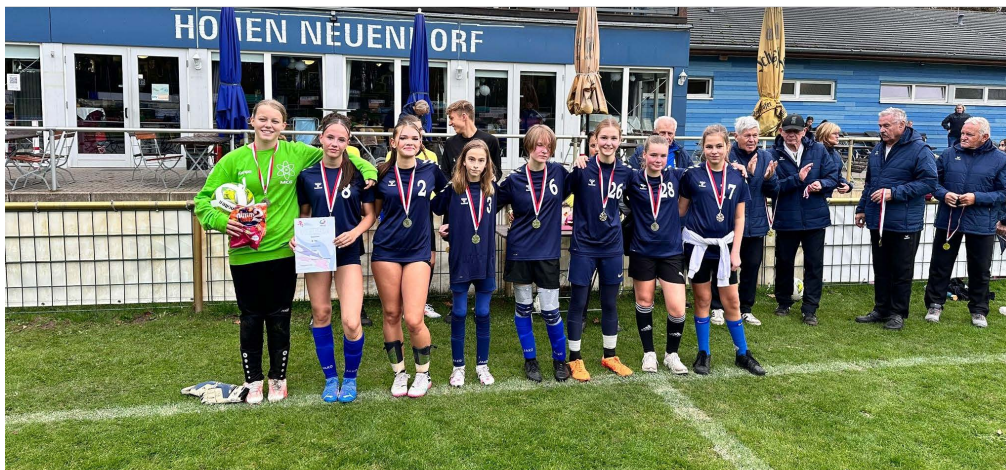
2. Platz Regionalfinale U15 weiblich Fußball