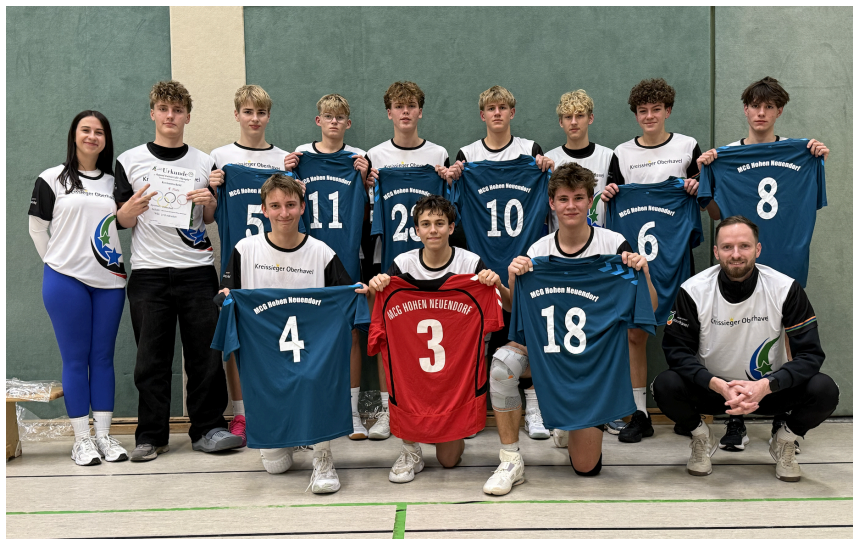
Sieger Kreisfinale am 3.12.2025