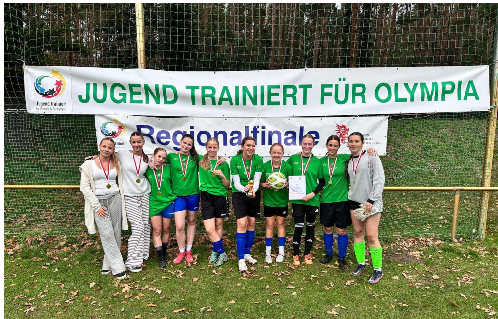
Regionalsieger U17 weiblich Fußball