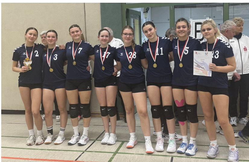
Siegerinnen im Regionalfinale am 13.1.2026