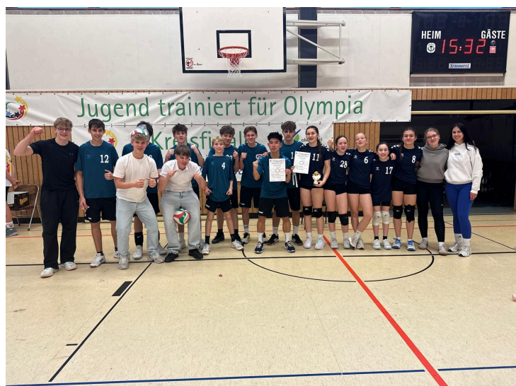
Mädchen: Siegerinnen im Kreisfinale am 10.12.2025