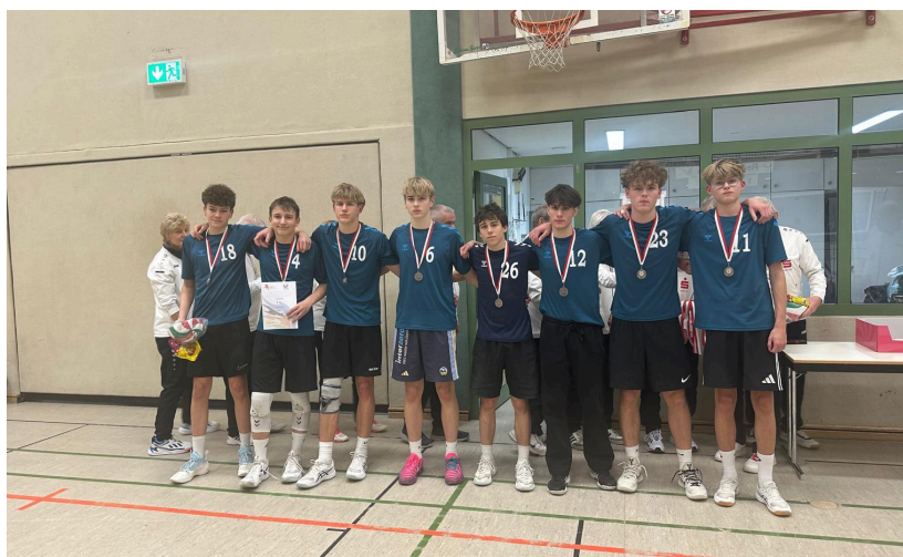
2. Platz beim Regionalfinale am 14.12.2025