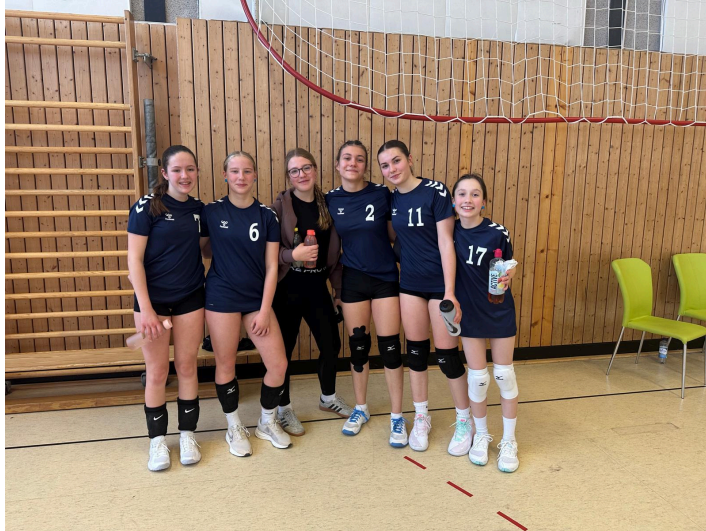
Siegerinnen im Regionalfinale U 16 am 8.1.2026

Regionalfinale Volleyball U 16 männlich und weiblich